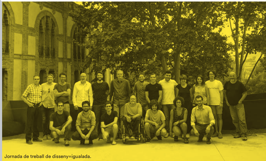
Jornada de treball de disseny=igualada.